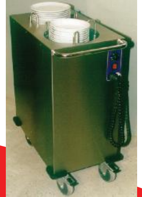
Sıcak Tabak Trolleyi